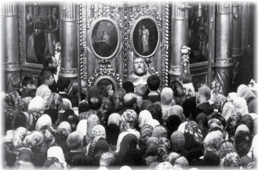
Проповедь в Михайловском соборе. 1980 г.