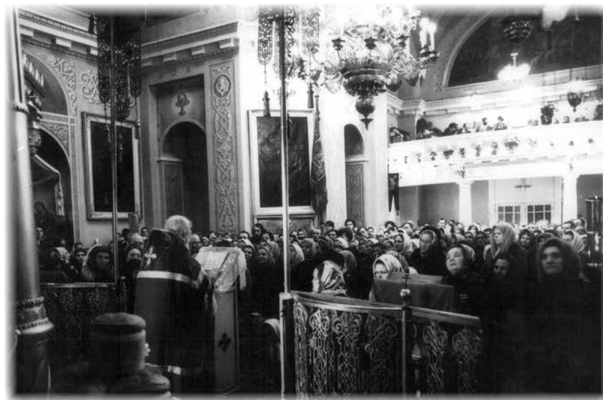
Проповедь в Михайловском соборе. 1971 г.