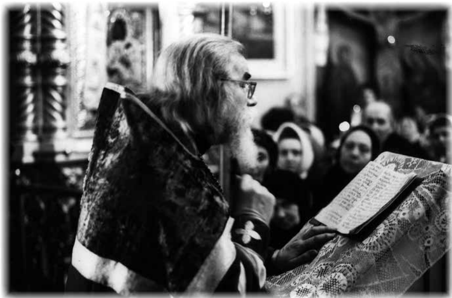
Проповедь. 1970 г.